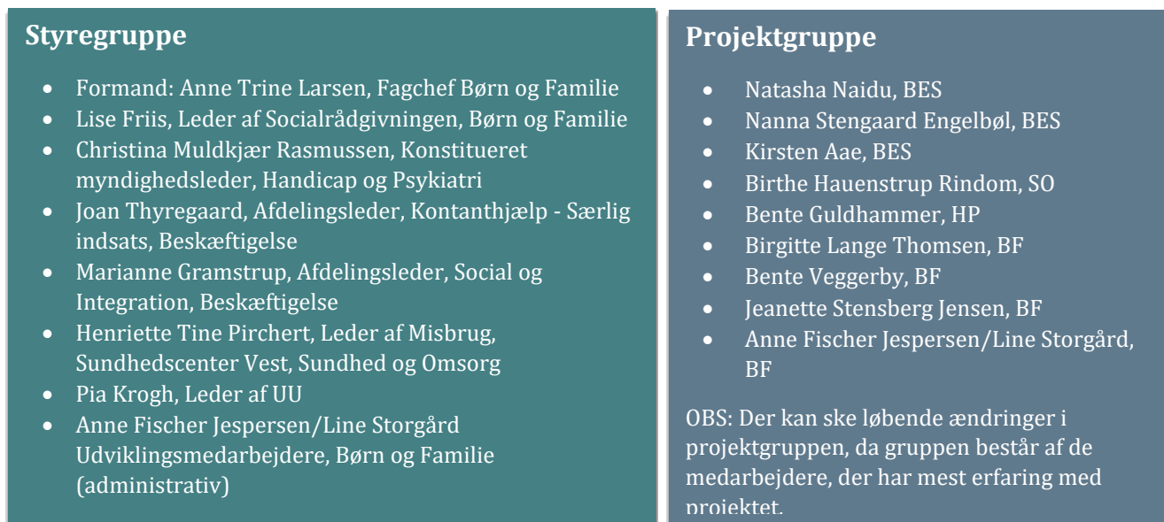
Figur 1. Samarbejdspartneres organisering illustreret.